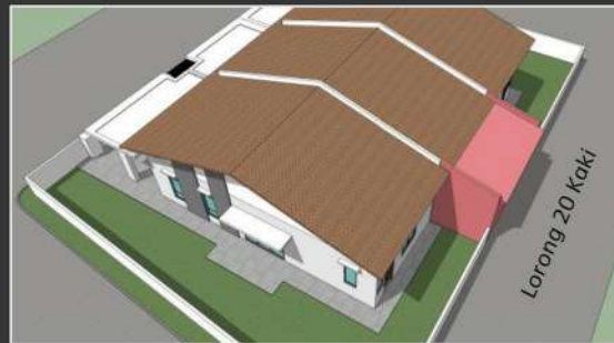
Sekiranya lorong belakang selebar 20 kaki (6096mm), Tiada anjakan diperlukan.

Lot 'Corner'– Perlu menyediakan anjakan minima 20 kaki (6096mm) untuk dinding dan 10 kaki (3048mm) untuk tiang 'terrace' dari sempadan sisi.