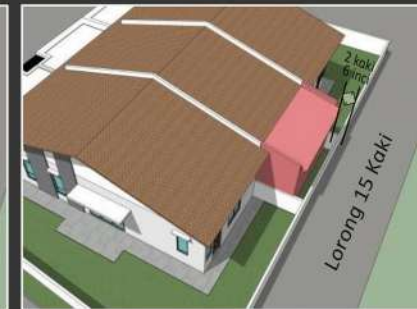
Sekiranya lorong belakang selebar 15 kaki (4572mm), anjakan minima adalah 2 kaki 6 inci (762mm) dari sempadan belakang diperlukan.