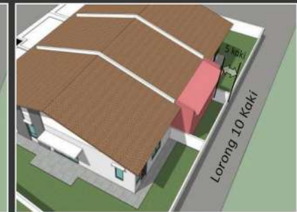
Sekiranya lorong belakang selebar 10 kaki (3048mm), anjakan minima adalah 5 kaki (1524mm) dari sempadan belakang diperlukan.