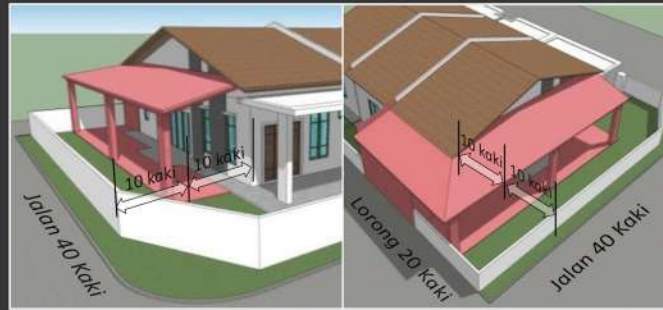
Pandangan Hadapan dan Sisi Pandangan Belakang dan Sisi

Jarak anjakan adalah suatu jarak lega dimana tiada sebarang binaan kekal boleh dibuat di kawasan tersebut.