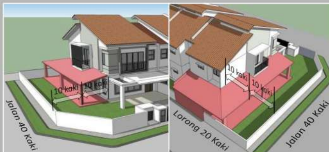
Pandangan Hadapan dan Sisi Pandangan Belakang dan Sisi

'End lot' – tiada anjakan sisi perlu disediakan