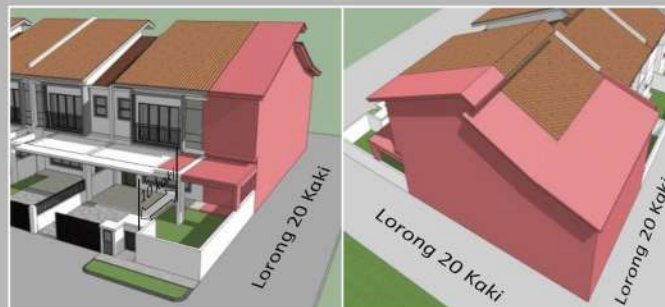
Pandangan Hadapan dan Sisi Pandangan Belakang dan Sisi

Lot 'Corner'– Perlu menyediakan anjakan minima 20 kaki (6096mm) untuk dinding dan 10 kaki (3048mm) untuk tiang 'terrace' dari sempadan sisi.